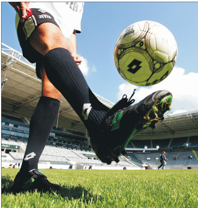
Vielen macht das richtig Spaß: Fußball spielen.

►Die Autoren sind Schüler der achten Klasse der Realschule Rottweil.