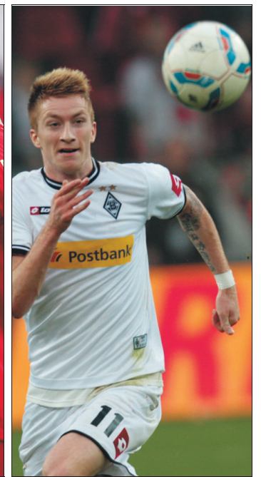
Ob die Dortmunder (links) am Ende der Saison wieder jubeln können? Oder vielleicht doch Schalke, die Bayern, eventuell auch Mönchengladbach (von links)?