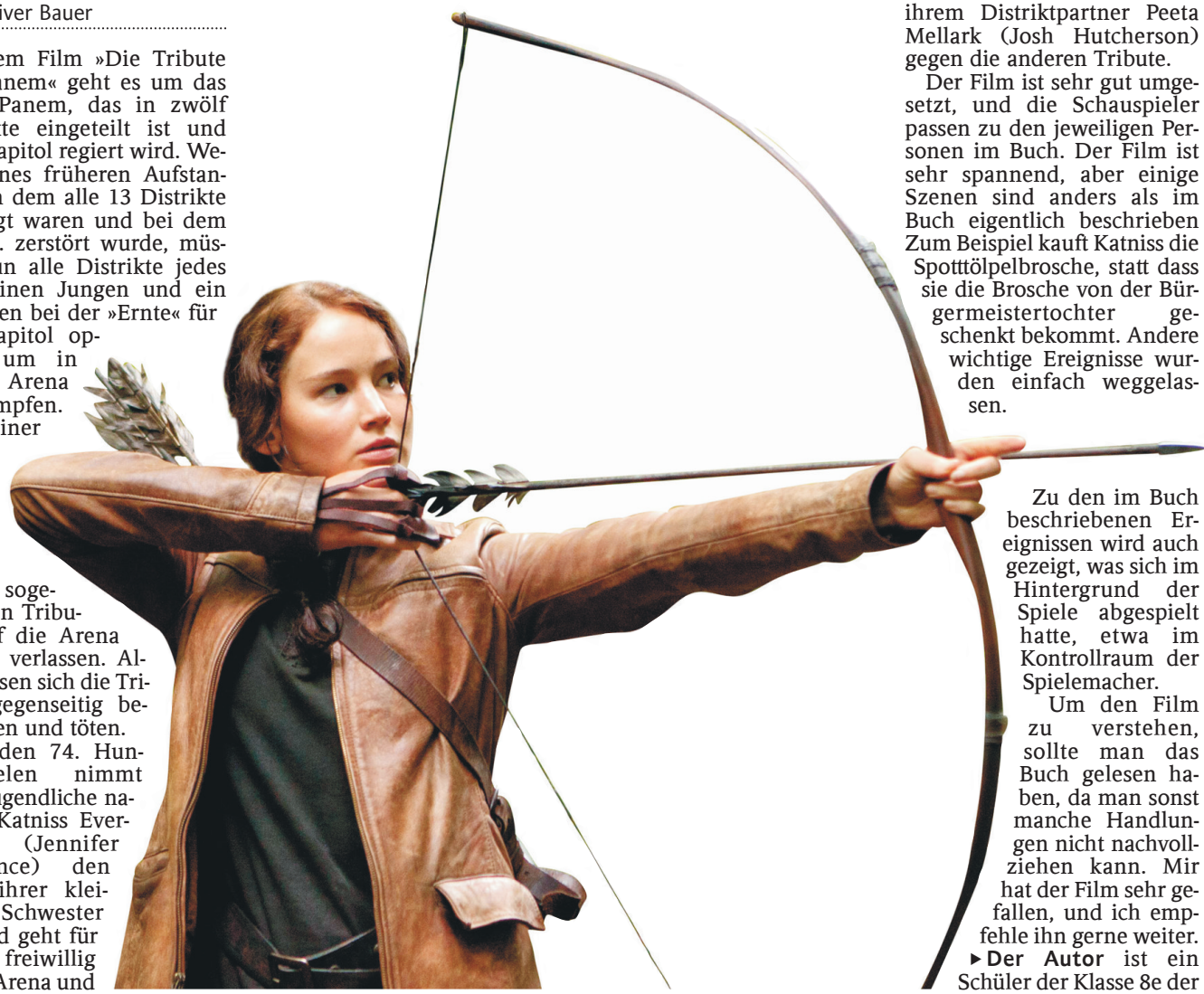
Katniss Everdeen tritt für ihre Schwester bei den Hungerspielen an.

Bei den 74. Hungerspielen nimmt eine Jugendliche namens Katniss Everdeen (Jennifer Lawrence) den Platz ihrer kleinen Schwester ein und geht für diese freiwillig in die Arena und kämpft mit